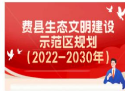
图解——《费县人民政府关于...