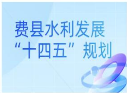
图解——《费县人民政府关于...