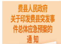
图解——《费县人民政府关于...