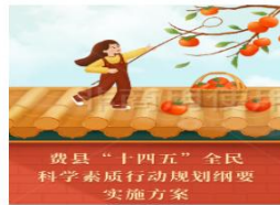
图解——《费县“十四五”全...