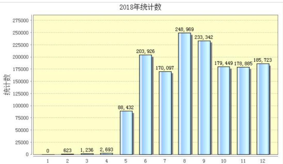
2018年度费县人民政府网站浏览量统计

2018年，我县通过政府网站主动公开政府信息10684条，通过微信和微博公众号主动公开政府信息2612条。同去年相比，一是加大了主动公开的力度，二是丰富了政策解读的形式，三是提高了公众的参与度。